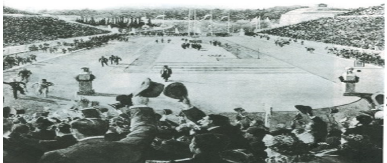
Ο Λούης τερματίζει (αναπαράσταση)