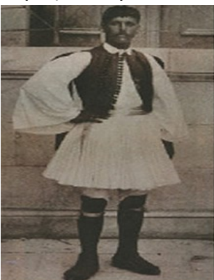
Ο ολυμπιονίκης Σπύρος Λούης

Εκεί, στο Παναθηναϊκό στάδιο, οι Έλληνες ξεφωνίζουν σ' ένα χώρο που τους ανήκει από παλιά. Ένα χώρο με εθνικό παρελθόν, ένα χώρο που αποκτά και εθνικό παρόν, μ' ένα νερούλα από το Μαρούσι που έτρεξε 40 χιλιόμετρα σε δύο ώρες, 58 πρώτα και 50 δευτερόλεπτα.