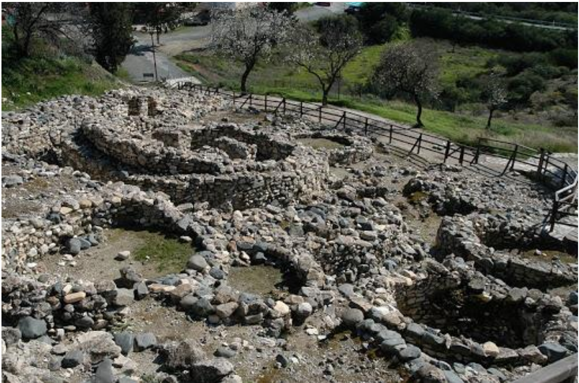
Οι βάσεις των σπιτιών όπως σώζονται σήμερα www.salamisinternational.com