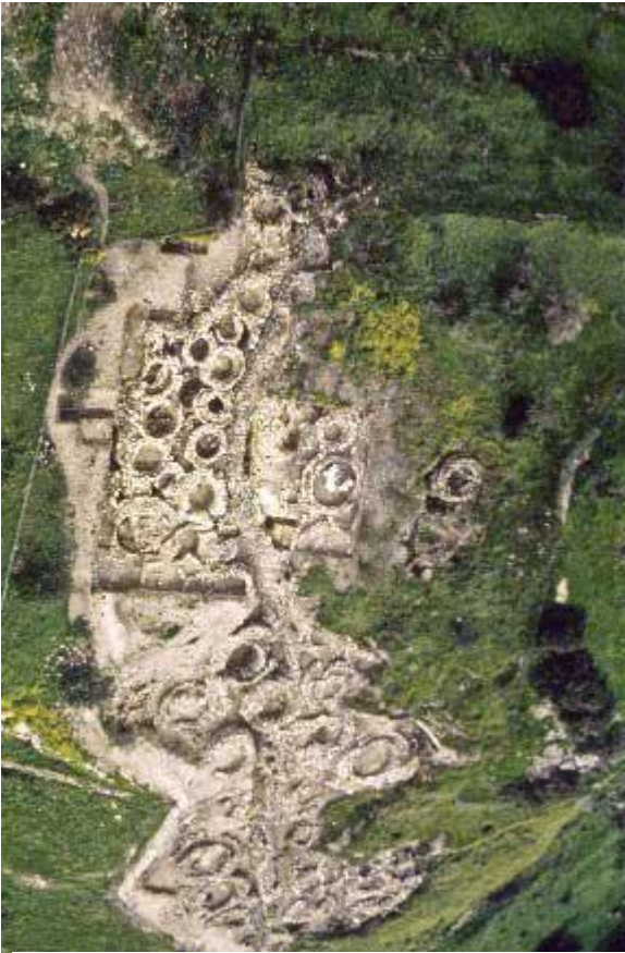
Αεροφωτογραφία του οικισμού