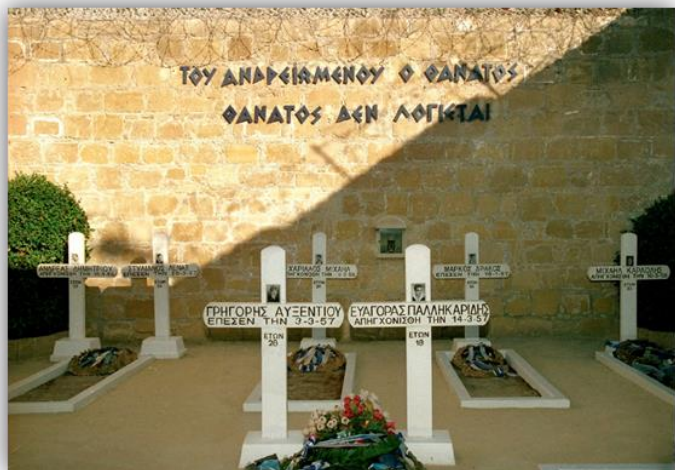
Τα φυλακισμένα Μνήματα