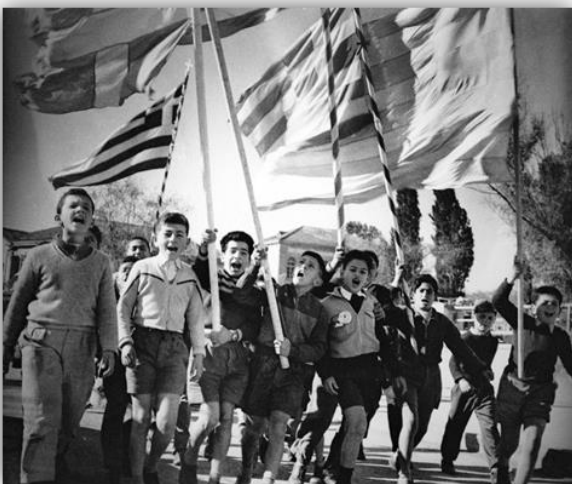
Οι μαθητές στον αγώνα